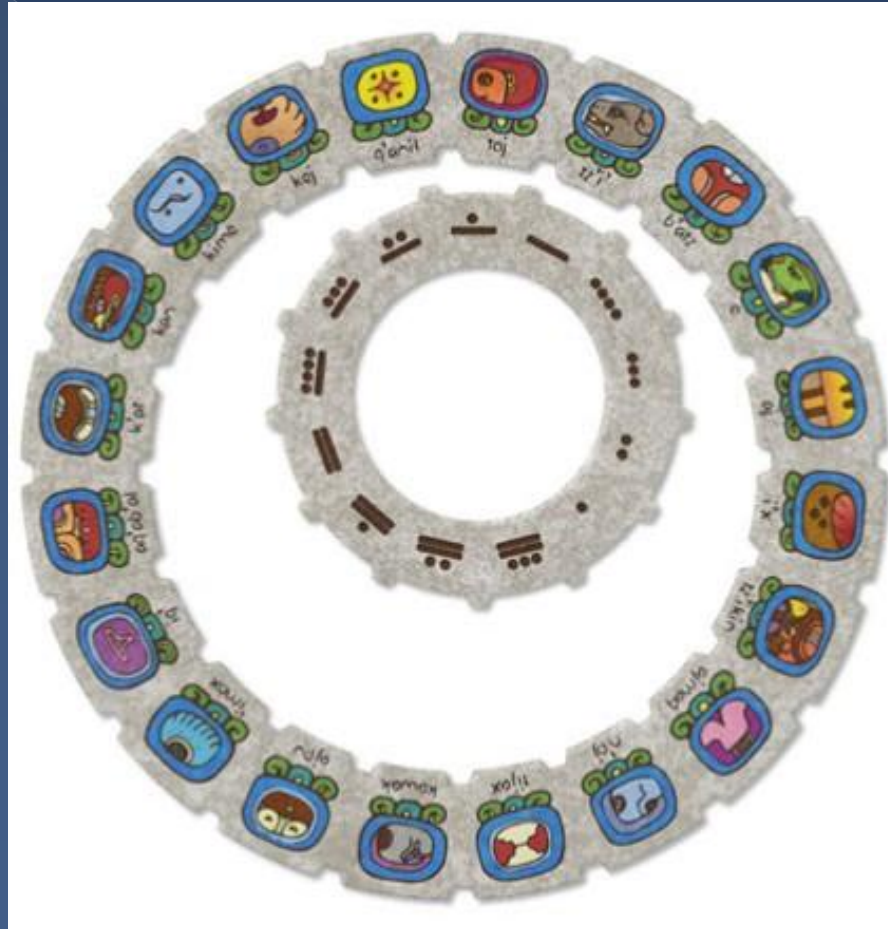
Exemple des mayas